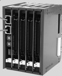
64in/64out DIOスレーブ HMG-D4