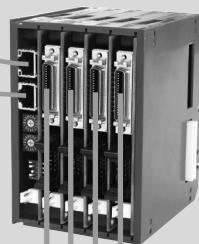
4軸モーションスレーブ HMG-P4